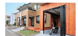
カクニビルダー フェアリスクエア西川田展示場 栃木県宇都宮市西川田町245-1