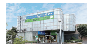
カクニビルダー 本社ショールーム 栃木県鹿沼市上野町281-4

カクニビルダーでは、さまざまなテイストの展示場や打ち合わせができるショールームをご用意しております。家づくりのご相談は、下記のフリーダイヤルまたは、公式ホームページより、お近くの店舗をご予約ください。