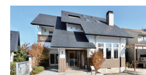
カクニビルダー CRT宇都宮西展示場 栃木県宇都宮市細谷町753-3