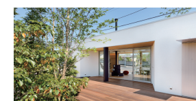
カクニビルダー デザインショールーム 栃木県鹿沼市上野町281-4